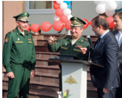
Открытие школы IT-технологий

В соответствии с решениями Министра обороны Российской Федерации №173/УВО/4/5642 от 31 октября 2014 года и №173/УВО/4/6055 от 17 ноября 2014 года на базе Военной академии связи (далее Академия) был создан Кадетский корпус (школа IT-технологий, далее Школа).