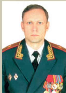
Масленников Олег Викторович, начальник 1 управления ГУС ВС РФ, генерал-майор

Олег Викторович Масленников родился 23 сентября 1963 года в г. Горьком.