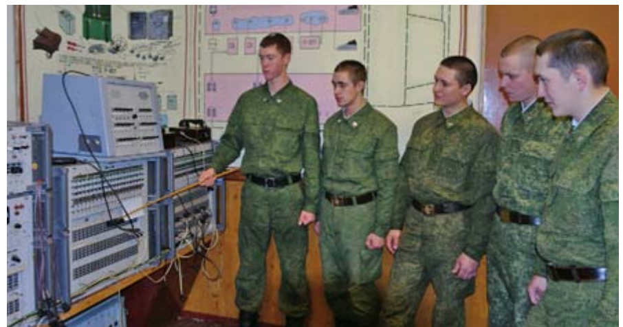
Занятие по специальной подготовке