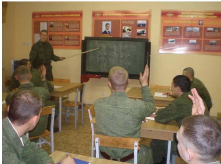
Занятие по специальной подготовке

В 2001 году после окончания Технического лицея города Пскова поступил в Новочеркасское высшее командное краснознаменное училище связи. По выпуску проходил службу в Московском военном округе в отдельном гвардейском батальоне связи в должности командира радиовзвода роты связи ЗКП. Уже через полгода был назначен на должность команди-