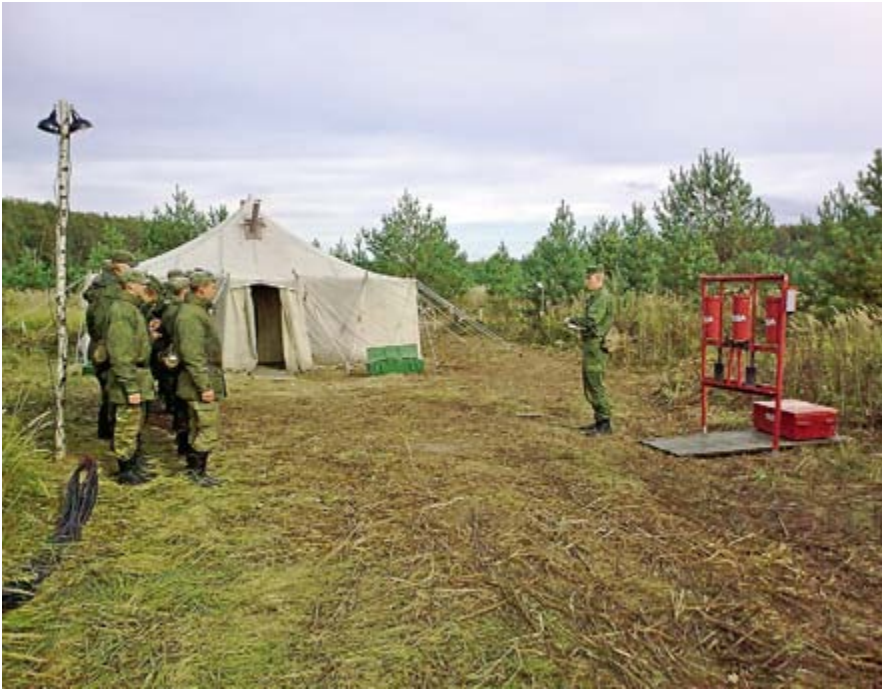
Инструктаж суточного наряда

Главы администрации (Губернатора) Ростовской области. В 2011 г. окончил НВВКУС, получил диплом с отличием и был направлен для прохождения военной службы в Гвардейский межвидовой окружной учебный московско-тартуский краснознаменный центр.