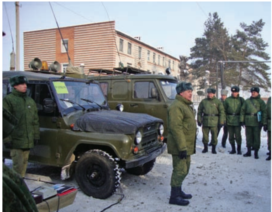
Сборы с начальниками связи соединений на базе 104 бру

Принимал активное участие при монтаже и вводе в эксплуатацию новых образцов техники связи, удовлетворяющих современным требованиям системы управления