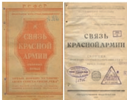
Обложка первого Сборника «Связь в Красной Армии». 1921 г.

рии развития связи, подведены итоги обеспечения связи на фронтах и определены основные проблемы, подлежащие обсуждению на форуме.