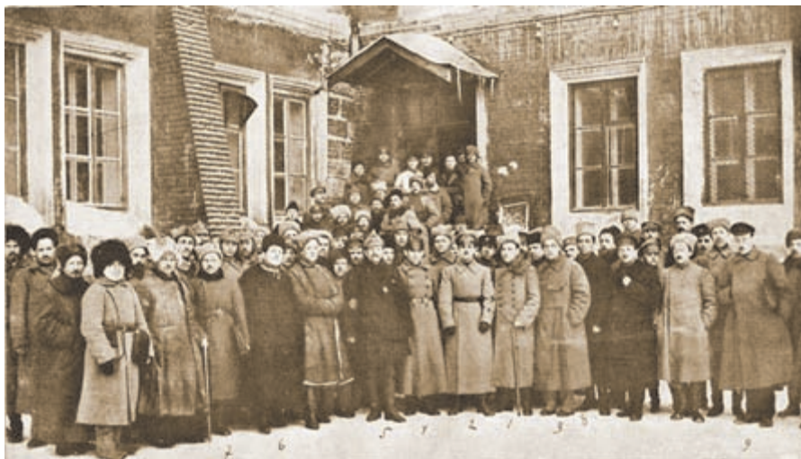
Делегаты 1-го съезда-совещания

общий комплекс средств военной связи и сосредоточить руководства все виды связи в руках одного лица — начальника связи (фронта, армии и т. д.).