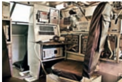
Тренажёр КШМ Р-149Т исполнения в корпусе БТР-80

Тренажер предназначен для изучения и тренировки личного состава эксплуатации штатного оборудования командно-штабных машин (КШМ), совершенствования практических навыков должностных лиц по связи в управлении действиями подчинённых и разработке документов боевого применения средств и комплексов связи, а также проведения штабных тренировок с должностными лицами пункта управления.